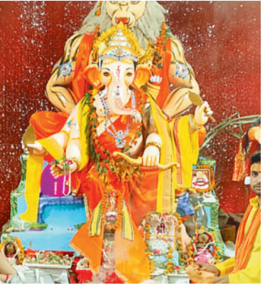
बसुकु रोड सार्वजनिक श्री गणेश पूजा समिति राजेश गांधी चौक चरचा कॉलेज