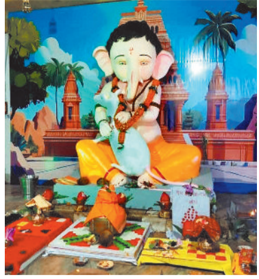
चकरहरीपारा दुर्गा पंडाल में विराजे भगवान श्रीगणेश