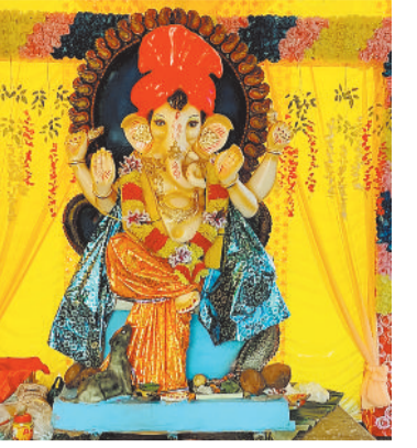
श्री गणेश पूजा समिति व्हीटीसी कालोनी चरचा