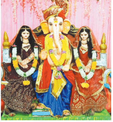
श्री गणेश पंडाल ओडगो नाका में विराजे भगवान श्री गणेश