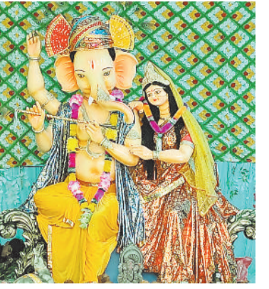
श्री गणेश पूजा समिति कारपेटिव लाइन चौक चरचा कॉलेज