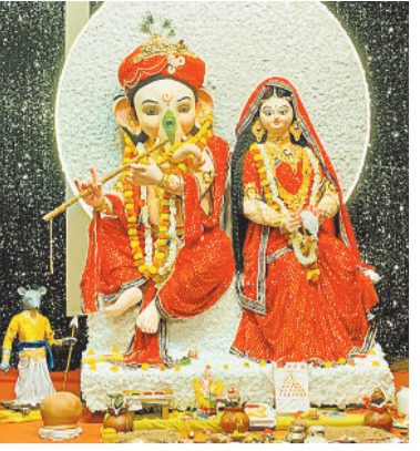
श्रीराम सेवक गणेश पूजा युवा समिति व्हीटीसी चौक चरचा कॉलेज